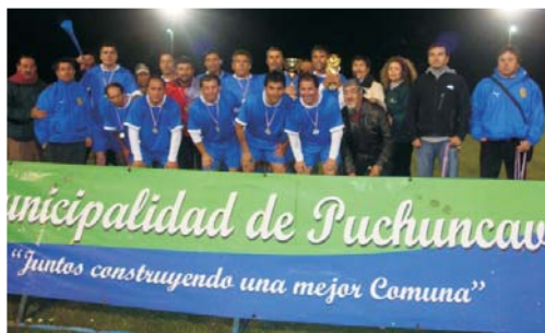
Campeón Categoría Super Senior

Una entretenida jornada deportiva se vivió el viernes 1 de octubre con motivo de la finalización del Campeonato de Fútbol Bicentenario, organizado por la Municipalidad de Puchuncaví, en conjunto con las Asociaciones de Fútbol de Puchuncaví y Las Ventanas.