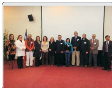
Fue conformado Consejo Asesor Empresarial en la Comuna de Puchuncaví (Pág. 2)