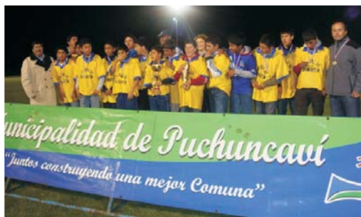
Campeón Categoría Sub 14