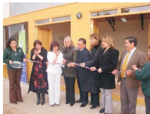
Autoridades realizan tradicional corte de cinta en la Inauguración de la nueva sede de la Unión Comunal de Juntas de Vecinos

La nueva sede cuenta con un salón principal, un baño, una cocina y una bodega, donde los socios de la UNCO podrán desarrollar diversas actividades que vayan en beneficio de la institución.