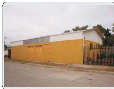
Unión Comunal de Juntas de Vecinos cuenta con nueva Sede (Pág. 9)