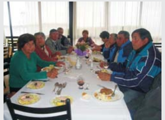
Adultos Mayores disfrutaron de un rico almuerzo.

Con gran entusiasmo se desarrolló el jueves 14 de octubre, la Celebración Comunal del Adulto Mayor, la que este año congregó a cerca de 500 abuelitos.