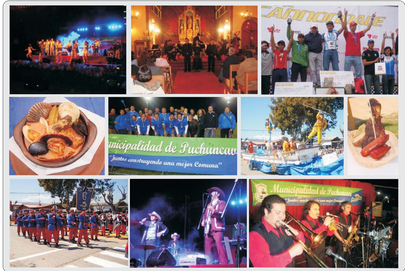
ESPECIAL: Celebraciones Mes Aniversario Comunal y Bicentenario de Chile (páginas 4, 5, 6, 7 y 8)