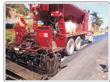
Municipio repara primer tramo de Avenida del Mar de Maitencillo (Pag.10)