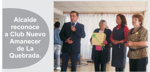
Alcalde reconoce a Club Nuevo Amanecer de La Quebrada.