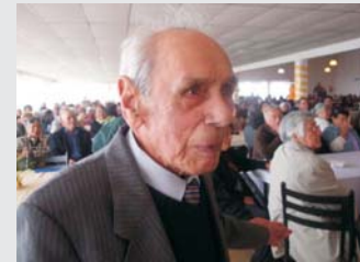
“Memito”, abuelito de 94 años, ganador del remate